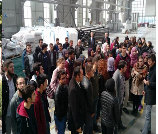
Altınekin Beta Ziraat Tesisleri