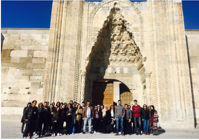
Aksaray Sultan Hamı