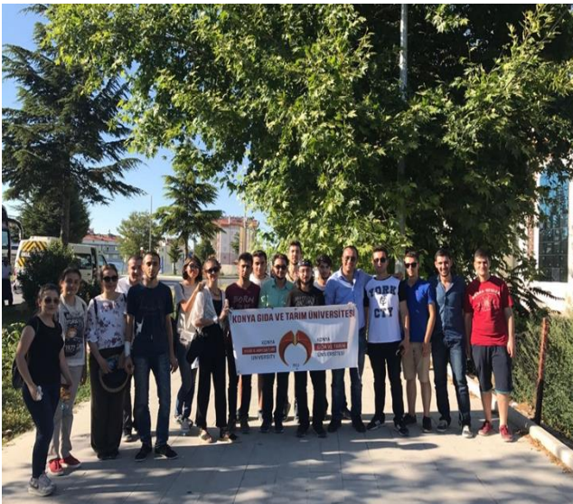
Beyşehir Sosyal ve Kültürel Gezisi