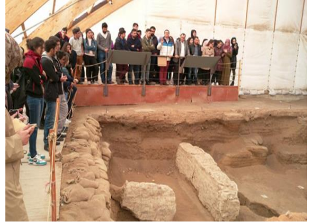
Çatalhöyük Antik Kenti