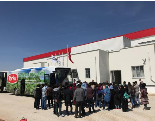
Seydibey Dondurulmuş Parmak Patates Tesisleri