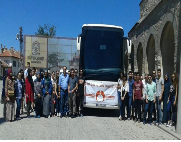
Beyşehir Eşrefoğlu Camii