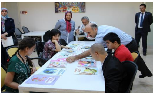
Kütüphaneye giderek kitaplar, kütüphaneden kitap alımı süreçleri hakkında Kütüphane Daire Başkanından Bilgi Alınması